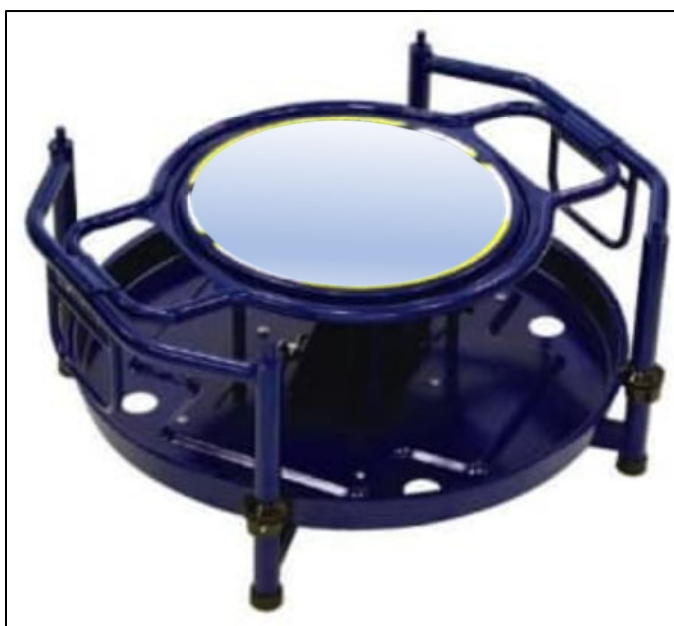
ケーブルリールの写真